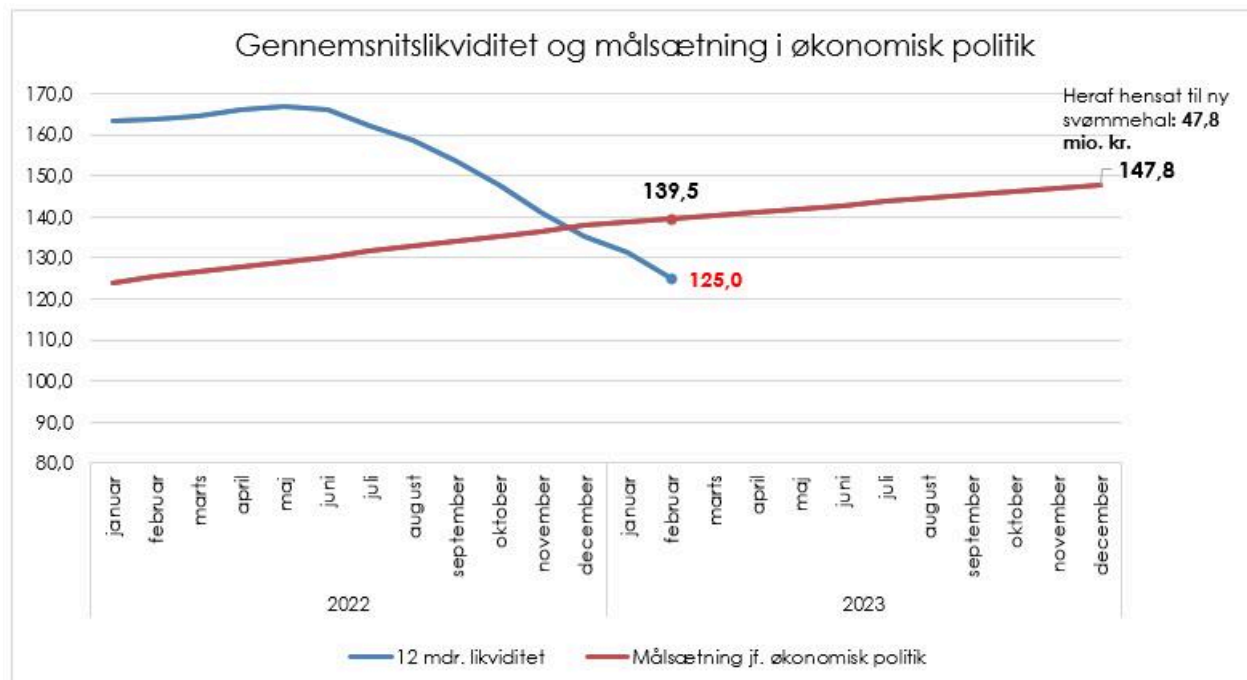
Figur 2: Opfølgning på likviditetsmålsætning i den økonomiske politi

likviditetsvirkningen af opsparing fra budgetaftaler. Ultimo 2023 skal likviditeten inklusive opsparing udgøre 147,8 mio. kr. Som det fremgår af ovenstående er målsætningen pr. 28. februar ikke overholdt, idet likviditeten efter kassekreditreglen er bagud og faldende ift. den opsparingskurve der burde være, hvis der blev sparet op som forudsat i budgetterne.