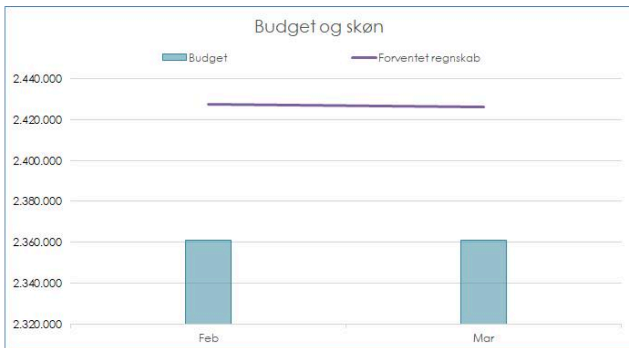
Tabel 1: Samlet drift - udvikling i budget og skøn, pr. 31. marts 2021.