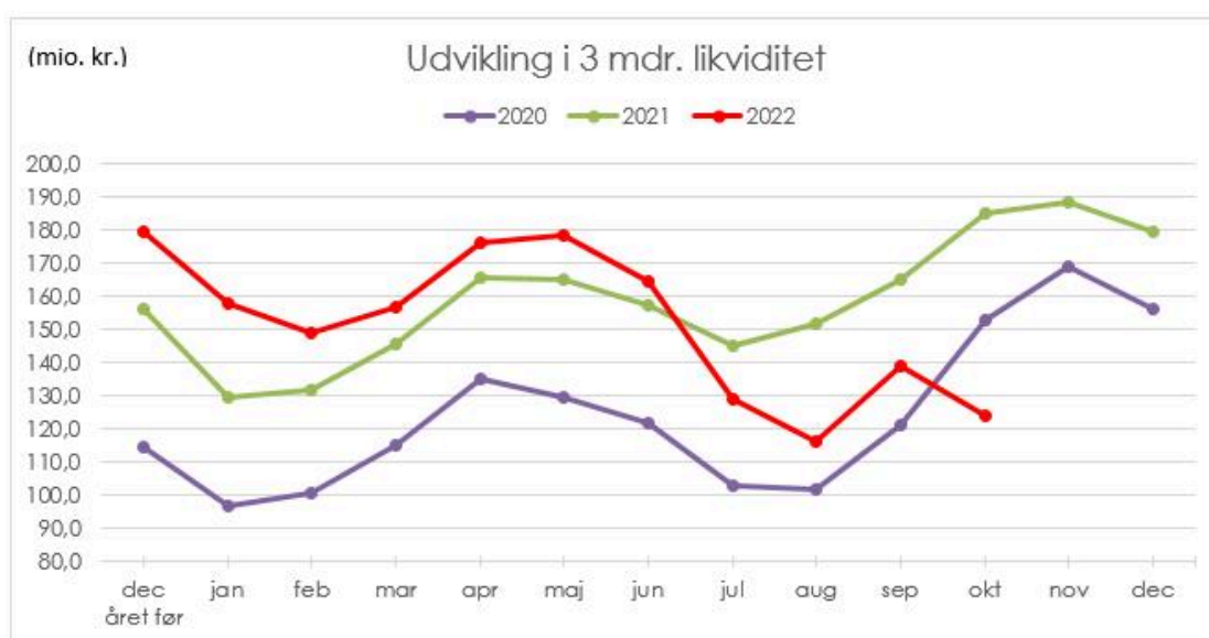
Figur 1: Udvikling i 3 måneders likviditeten

I figuren nedenfor vises 3 måneders likviditeten, hvor der tydeligt ses en afvigelse i mønsteret fra 2. halvår i 2022.