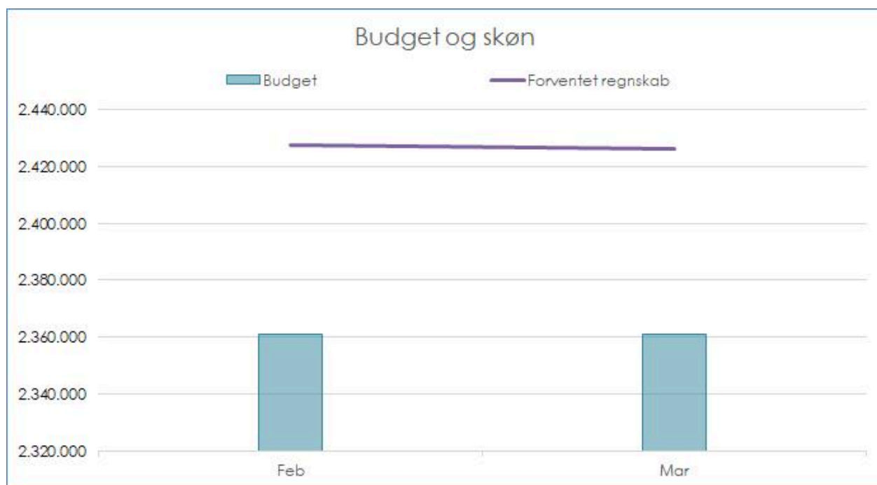
Tabel 1: Samlet drift - udvikling i budget og skøn pr. 31. marts 2021.